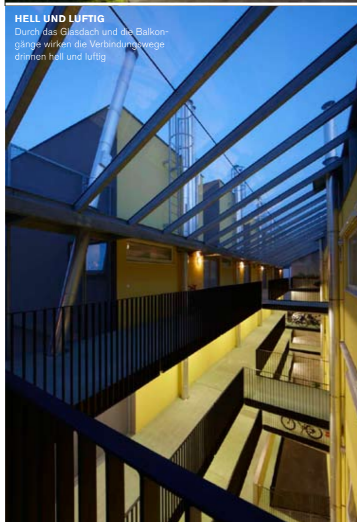
HELL UND LUFTIG Durch das Glasdach und die Balkongänge wirken die Verbindungswege drinnen hell und luftig