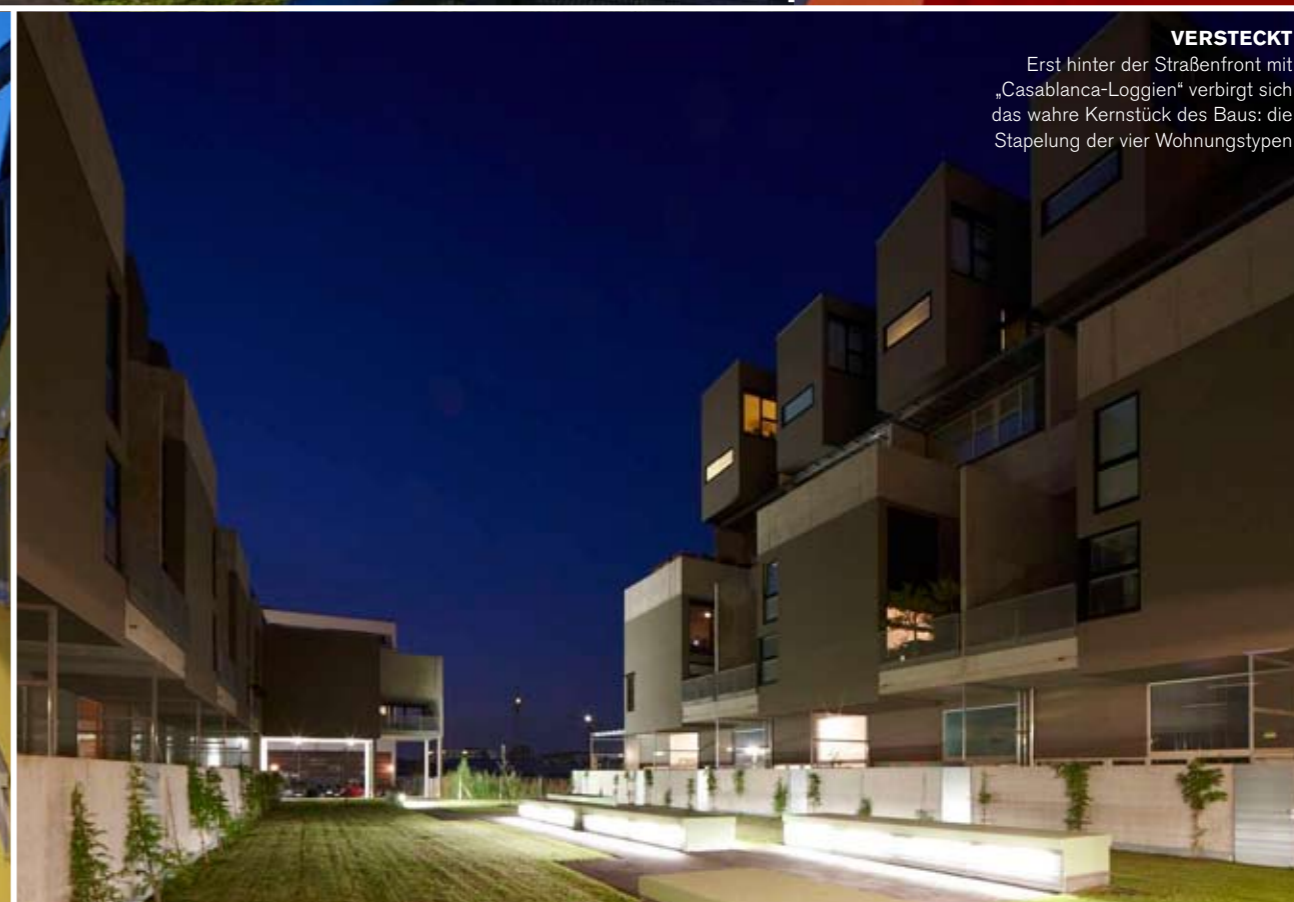
VERSTECKT Erst hinter der Straßenfront mit „Casablanca-Loggien“ verbirgt sich das wahre Kernstück des Baus: die Stapelung der vier Wohnungstypen