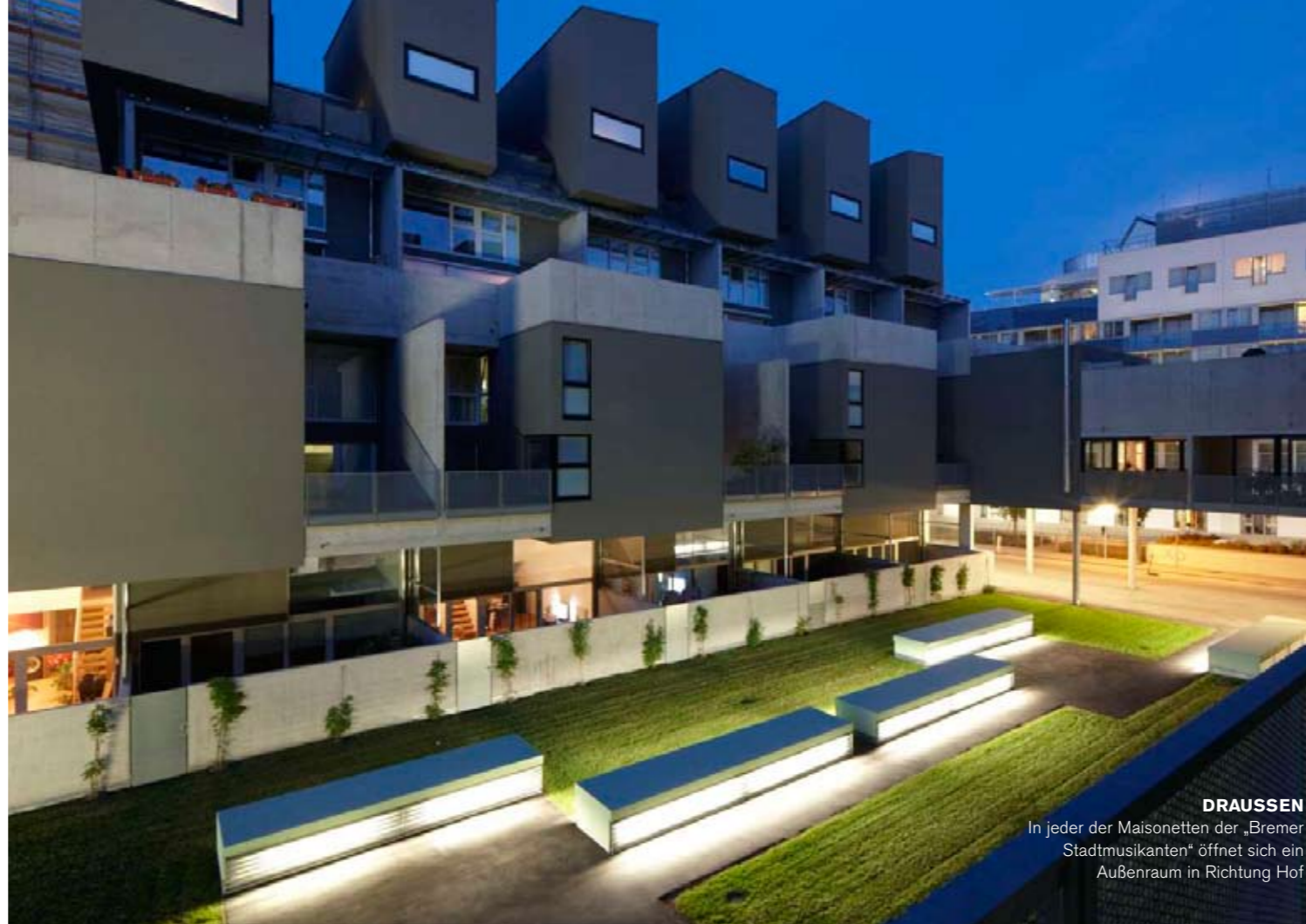
DRAUSEN In jeder der Maisonetten der „Bremer Stadtmusikanten“ öffnet sich ein Außenraum in Richtung Hof

Am Dach winkt die Chance, sich an so manchem Sommertag wie im Süden zu fühlen, thront hoch über Wien doch ein 15-Meter-Schwimmbad mit Liegemöglichkeit und Panoramablick; ein idealer Schnittpunkt für Kommunikation. An die Solidarität, die Esel, Hund, Katze und Hahn vorleben, wurde also auch gedacht. Sollte die Sonne jedoch einmal nicht zum Baden einladen, bleiben Gemeinschaftsraum und Kleinkinderspielplatz zur allgemeinen Nachbarschaftspflege. Auch die Eingangshalle bietet geschützten Raum für erste Versuche am Rad oder die Möglichkeit, ein Geschäft zu eröffnen – vielleicht einen Sushi-Stand, um der Gegend gerecht zu werden? Wer übrigens einen „neoprenen, orangen und kleinen“ Ball finden sollte, der möge sich doch auf den am schwarzen Brett befestigten, in roten Buchstaben als „WICHTIG“ gekennzeichneten Appell an die Solidarität eines jungen Hausbewohners melden, der sein Spielzeug verloren hat. Vielleicht bekommt der ein oder andere beim Eintreten in den vielfältigen Wohnkomplex ja auch selbst Lust, sich in dem märchenhaften Haus einzuquartieren – einige Wohnungen sind noch zu beziehen.